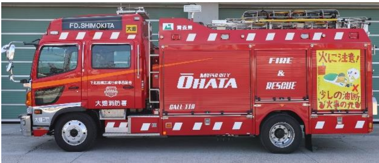
防火ポスターの展示